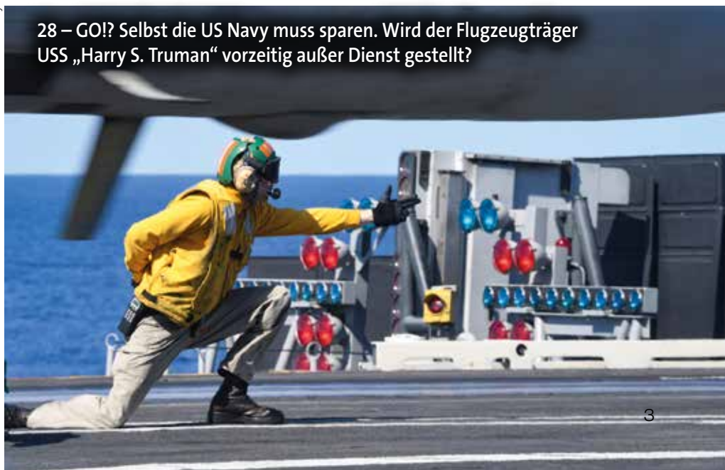
28 – GO!? Selbst die US Navy muss sparen. Wird der Flugzeugträger USS „Harry S. Truman“ vorzeitig außer Dienst gestellt?