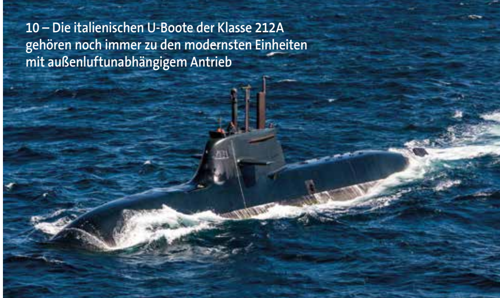
10 – Die italienischen U-Boote der Klasse 212A gehören noch immer zu den modernsten Einheiten mit außenluftunabhängigem Antrieb