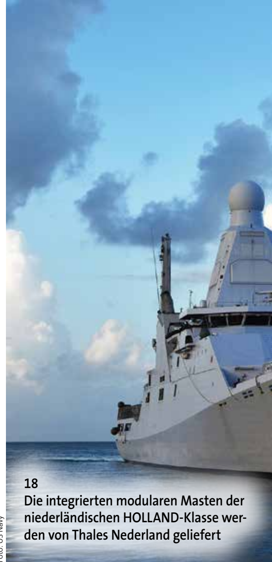
18 Die integrierten modularen Masten der niederländischen HOLLAND-Klasse werden von Thales Nederland geliefert