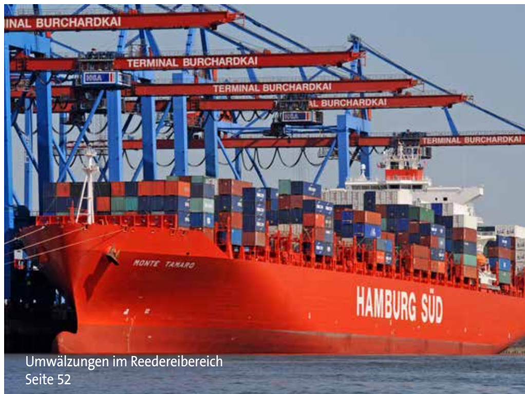
Umwälzungen im Reedereibereich Seite 52