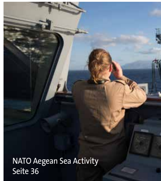
NATO Aegean Sea Activity Seite 36

Redaktionsschluss: 15.02.2017 Unterseeboot U32 im Nord-Ostsee-Kanal