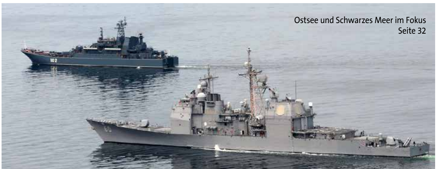
Ostsee und Schwarzes Meer im Fokus Seite 32

Redaktionsschluss: 15.02.2017 Unterseeboot U32 im Nord-Ostsee-Kanal