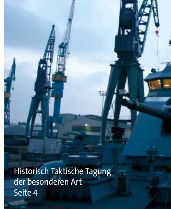
Historisch Taktische Tagung der besonderen Art Seite 4